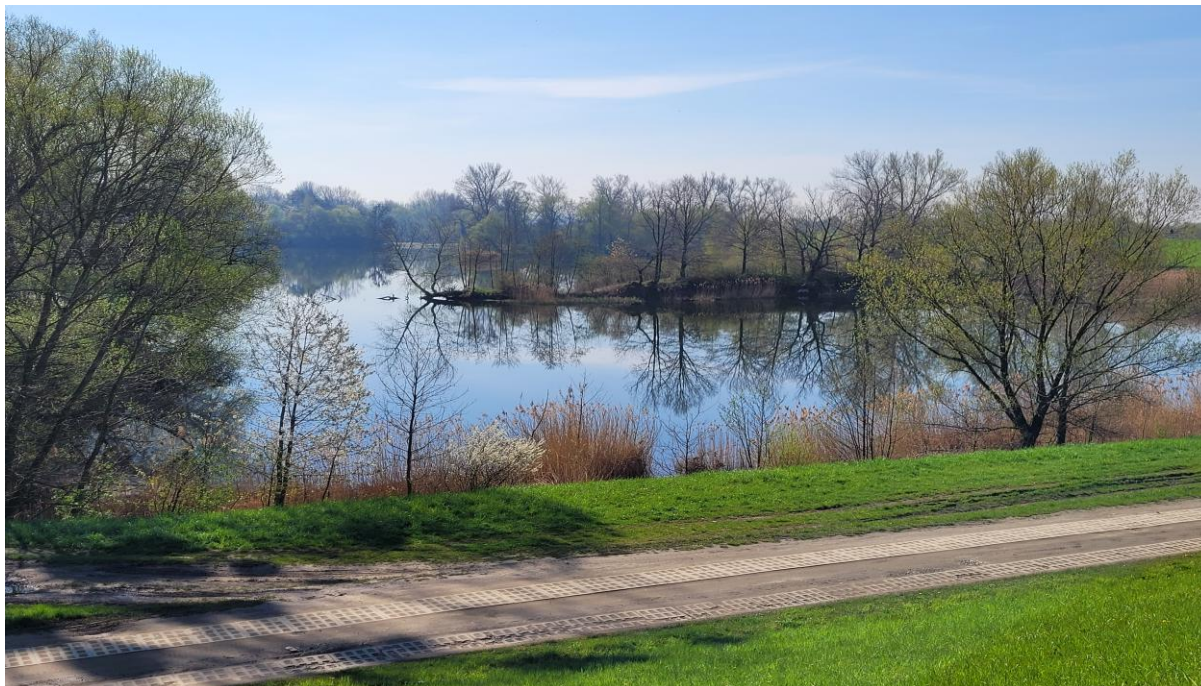
Wyrobisko poeksploatacyjne otoczone zadrzewieniami łągowymi zbiorowiskami szuwarowymi