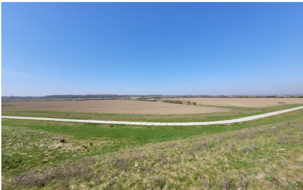
Mozaika pól uprawnych poprzecinanych rowami