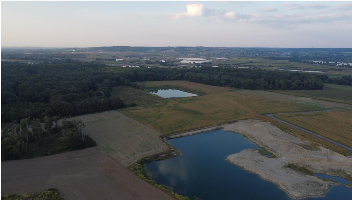
Mozaika krajobrazowa: okresowo zalane grunty rolne, płyty lasu, i niecki poeksploatacyjne wypełnione wodą