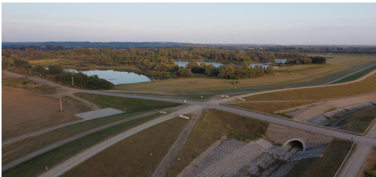
Infrastruktura zbiornika z wałami, rowami, przepustami i drogami technicznymi