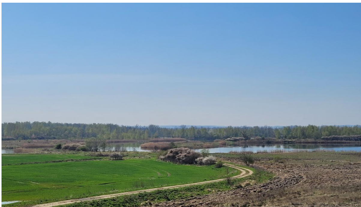
Różnorodność siedlisk tworzących mozaikę krajobrazową