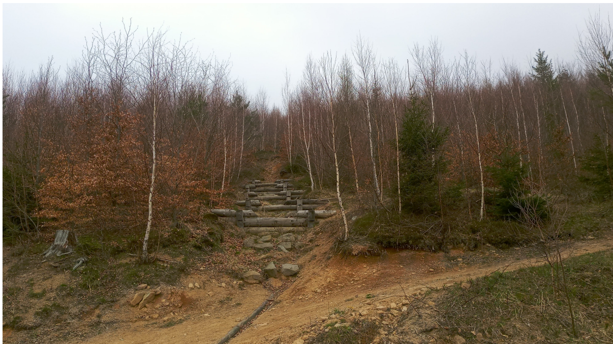
Zabezpieczenia przeciwozyjne rozcięć zainicjowanych erozją turystyczną w piętrze leśnym