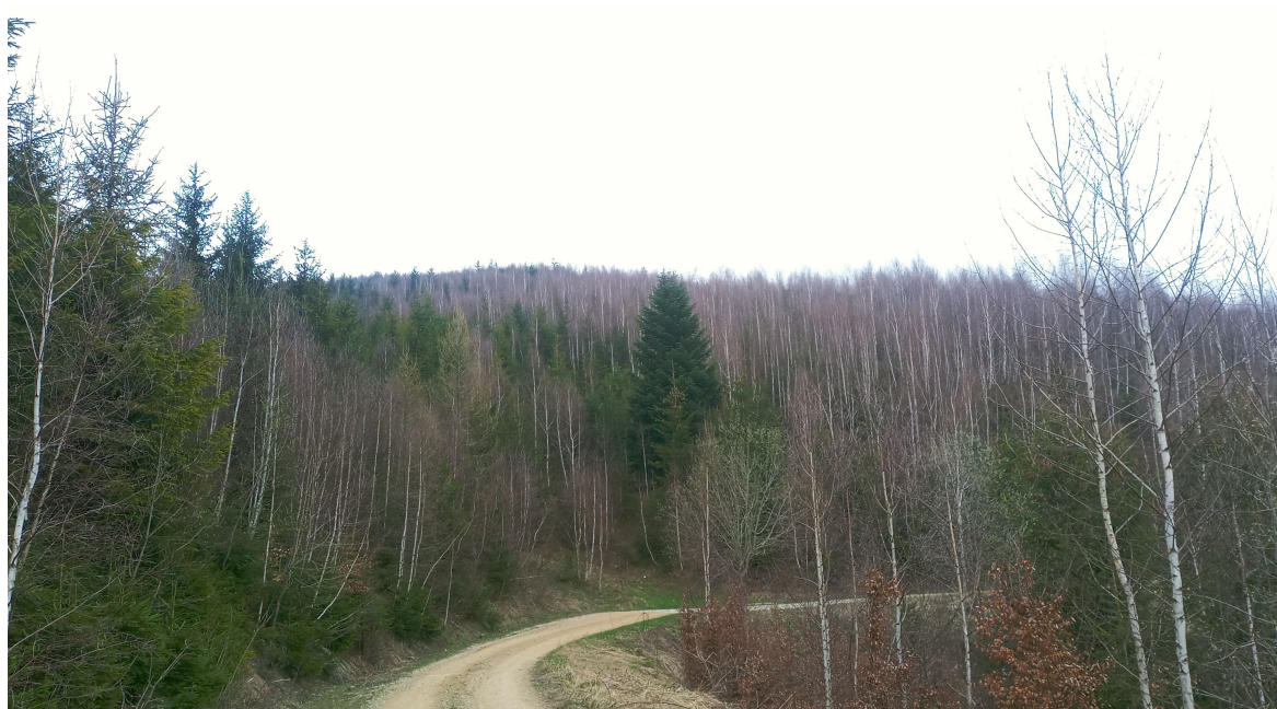
Krajobraz leśny z siedliskami lasowymi w rejonie Baraniej Góry