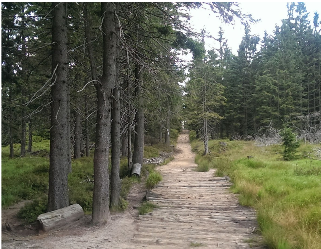
Bór górnoreglowy w partiach szczytowych Baraniej Góry z zabezpieczonym przeciwoerozyjnie szlakiem