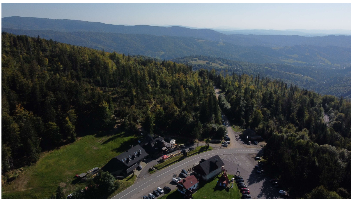
Widok z nad Przełęczy Salmopolskiej w kierunku Baraniej Góry