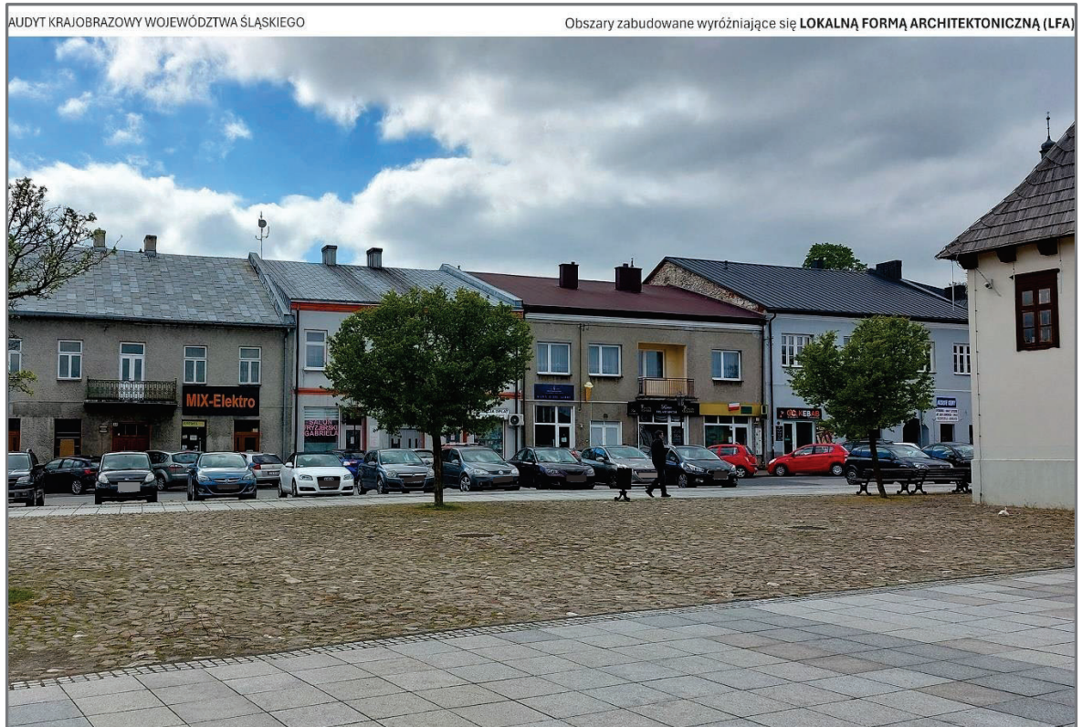
Ryc. 10. Pilica - widok na północną pierzeję Rynku. (fot. A. Grzybowski).