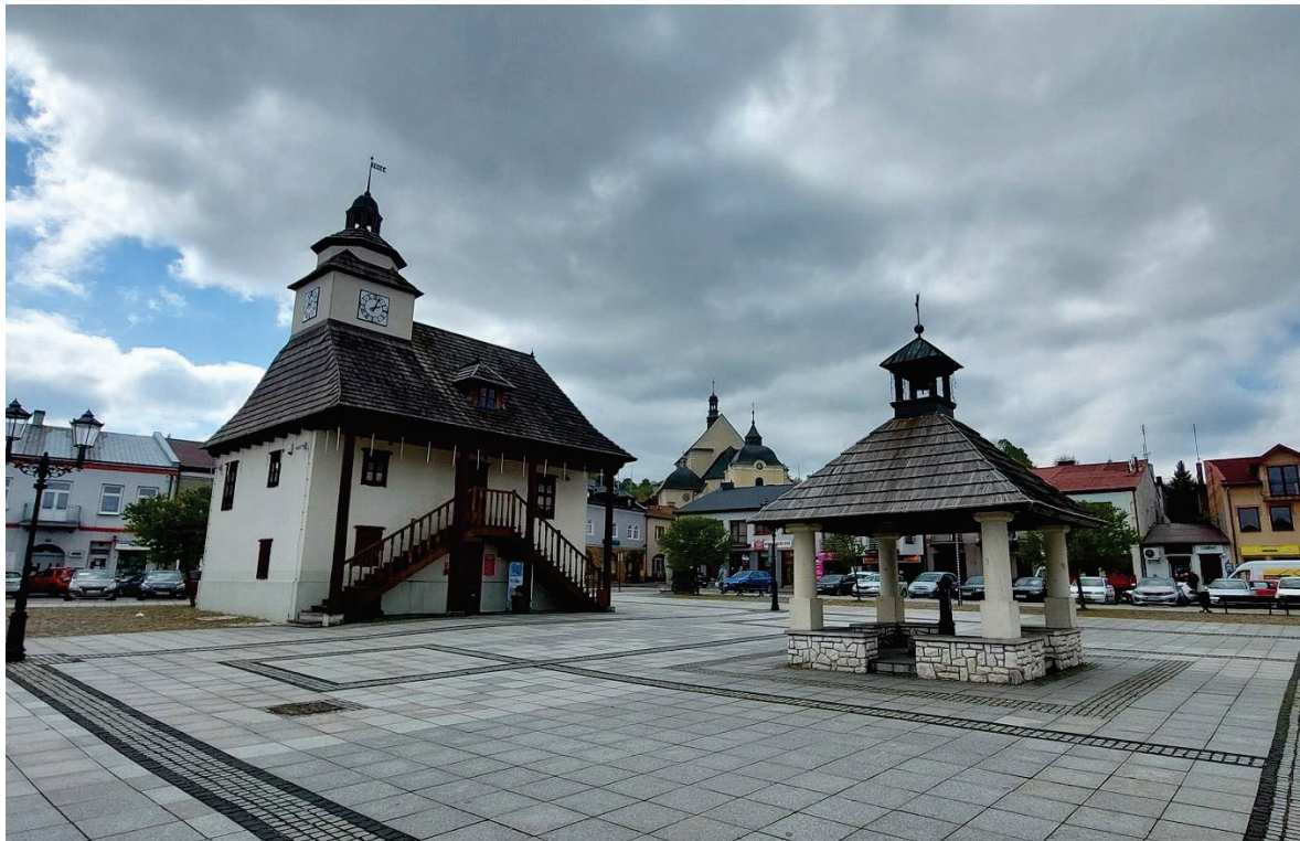
Ryc. 9. Pilica – widok Rynku z ratuszem i kościołem parafialnym.

Obszary zabudowane wyróżniające się LOKALNĄ FORMĄ ARCHITEKTONICZNĄ (LFA)