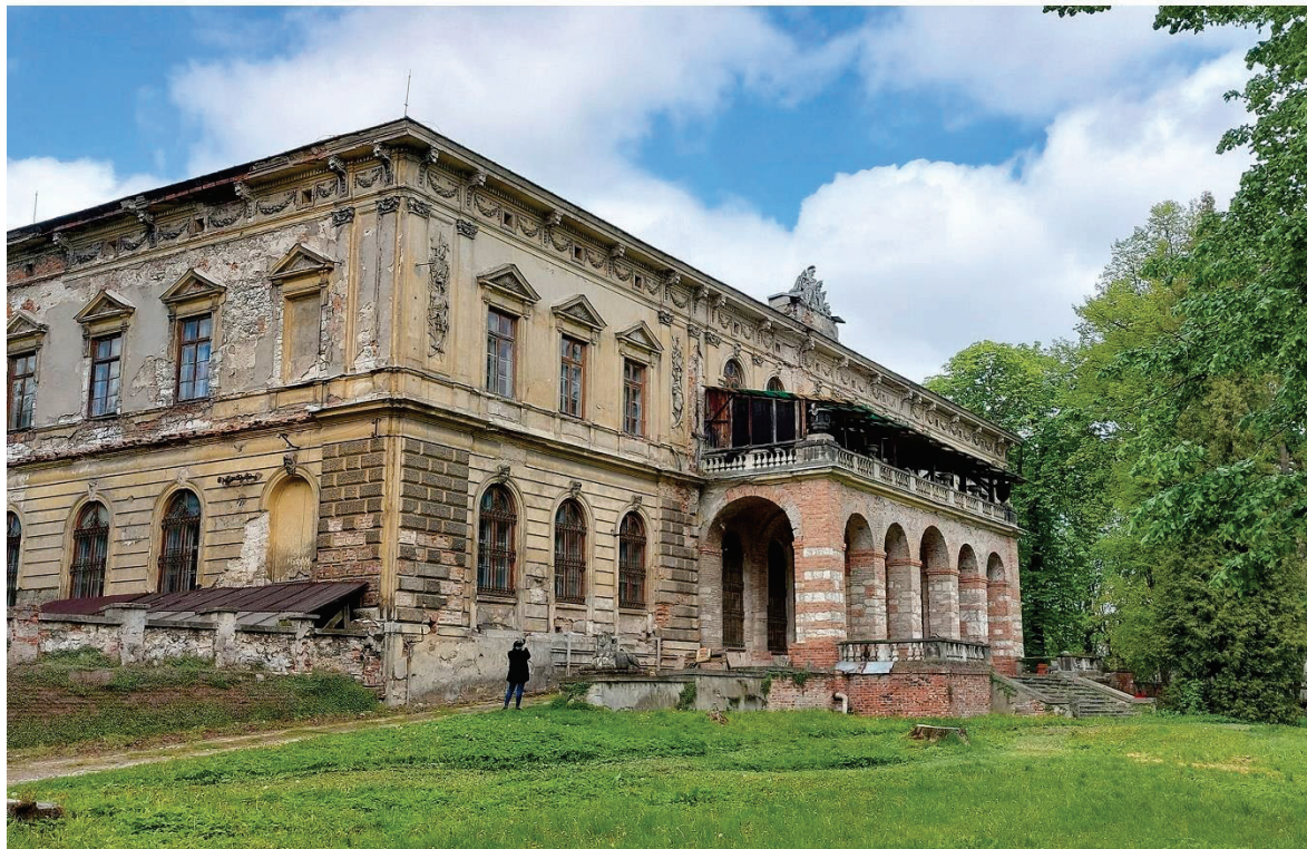
Ryc. 12. Pilica - Pałac Padniewskich z XVII-wieku w zespole parkowym (zlokalizowany w sąsiadującej jednostce/krajobrazie) (fot. A. Grzybowski).