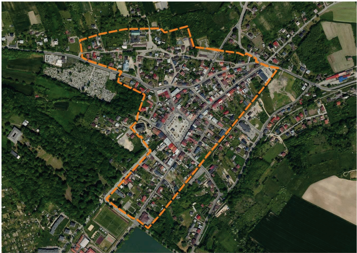
Ryc. 8. Pilica - zachowany średniowieczny układ miasta z rynkiem i siatką ulic.

AUDYT KRAJOBRAZOWY WOJEWÓDZTWA ŚLĄSKIEGO